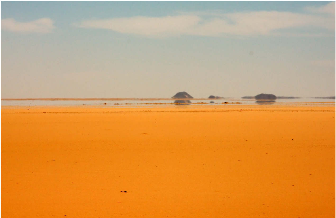
Illustration 1: Fatamorgana. Bemærk, at himmelen og klipperne er spejlede, så det ser ud som, der ligger vand foran en.

Herunder skal du arbejde med en model af atmosfæren, så fatamorganafænomenet bliver anskueliggjort.