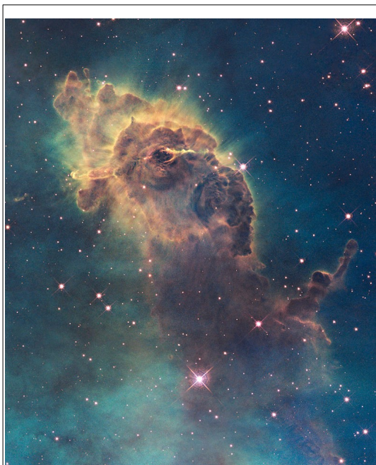
Illustration 1: Et billede af Carinatågen.

Herover skal man huske at indsætte \eta_i i procent.