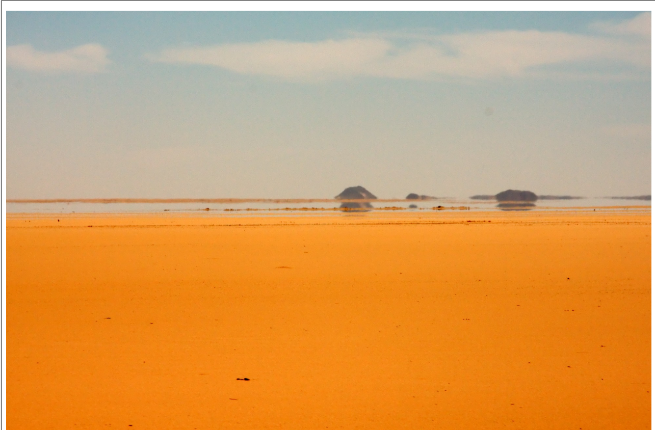
Illustration 1: Fatamorgana. Bemærk, at himmelen og klipperne er spejlede, så det ser ud som, der ligger vand foran en.

Her skal du arbejde med en model af atmosfæren, så fatamorganafænomenet bliver anskueliggjort.